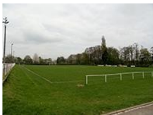
Stade de foot