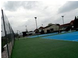
Cours de tennis