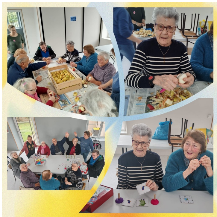
Atelier "compote de pommes" le 23 octobre

Différents ateliers ont été proposés à nos seniors pour leur plus grand plaisir :