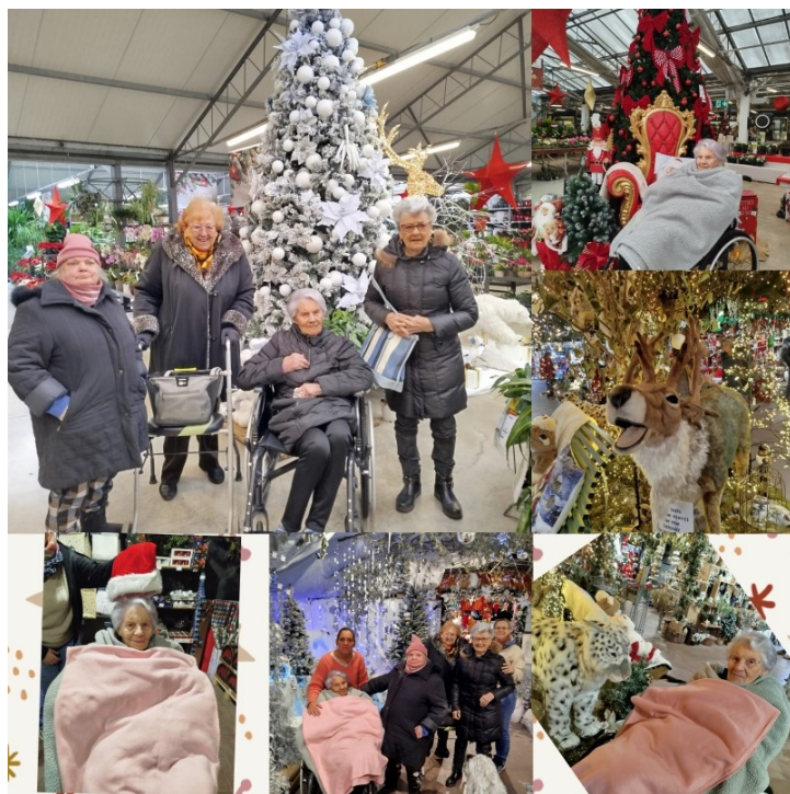
Sortie aux Serres de Mériot les 25 novembre et 3 décembre

Tous semblaient ravis de ces initiatives et prêts à recommencer l'année prochaine.